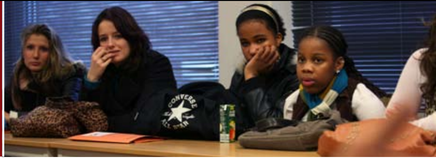
Holocaust Memorial Day