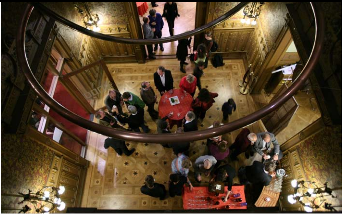
Boekpresentatie van Nanci Adler's 'Overleven na de Goelag'