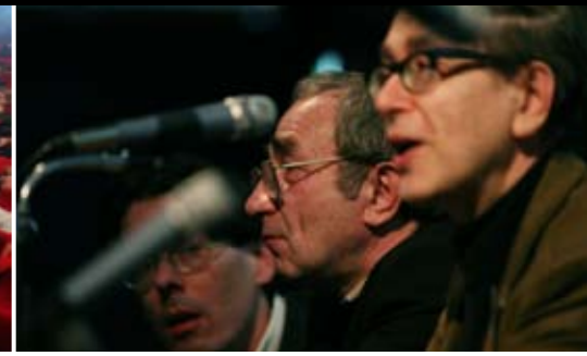
Debat met Arseny Roginskij

Onderzoeksjournalist Jonathan Sanders voorzag begin december zijn documentaire Beslan. Three days in september van een toelichting. Een kleine groep studenten en geïnteresseerden woonden deze indrukwekkende middag bij.