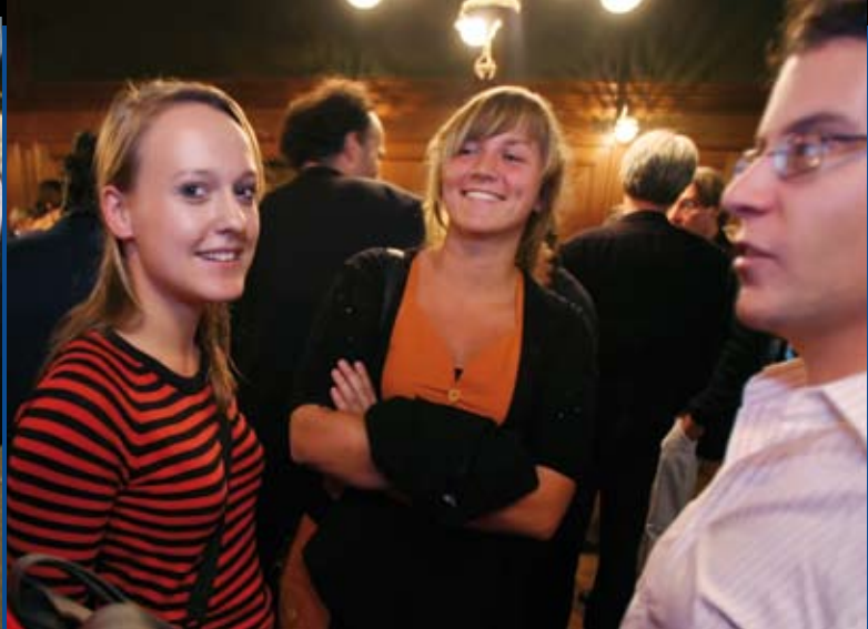
lezing Saul Friedländer