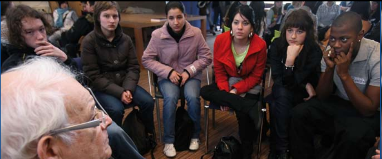
Holocaust Memorial Day